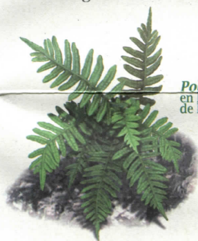
Polipodio común , en los ambientes umbríos de la senda

Uno de los atractivos del recorrido es poder conocer dos ambientes de gran interés paisajístico y natural: los cortados rocosos de conglomerados y los ambientes umbríos de los barrancos.