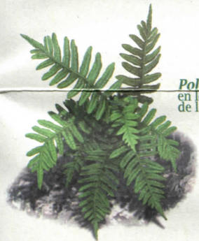
Polipodio común , en los ambientes umbríos de la senda

No todas las aves de los cortados se ven con la misma facilidad; sin embargo, hay una que, por su tamaño, rara vez pasa desapercibida, el buitre común . Las peñas de la zona acogen una pequeña colonia nidificante y un número variable de ejemplares que utilizan los cortados como refugio y posadero. Por ello, no será difícil que en nuestro recorrido veamos algunos en vuelo o sobre las peñas.